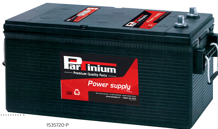
Bac heavy duty