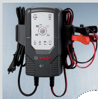
support de fixation